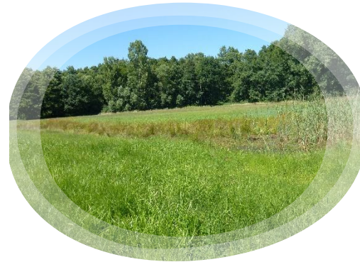
Auf Schleithaler Bann à Wissembourg