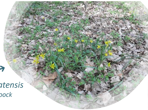
Gagea pratensis

Niveau débutant, ouvert à tous et sans inscription. De 19h à 20h, accès ici