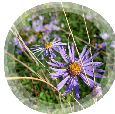
Aster amellus © A. Muller