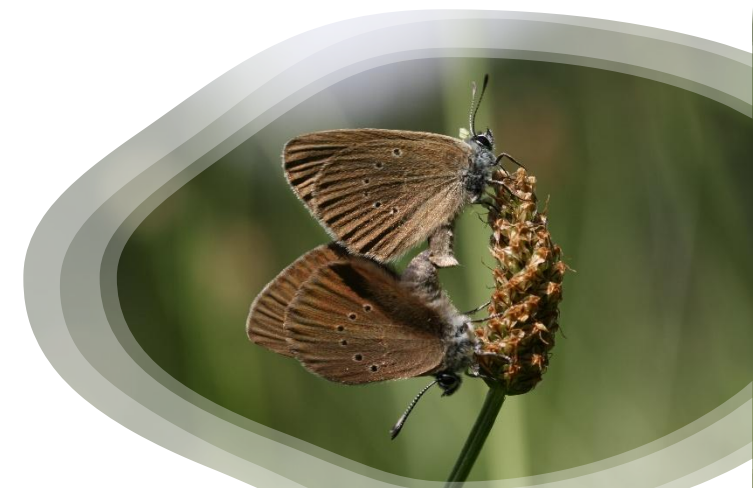
Phengaris nausithous

Des prospections en groupe sont organisées en juillet-août afin d'actualiser les données sur ces espèces dans la vallée de Villé et nous vous invitons à également les rechercher dans le reste de la région.