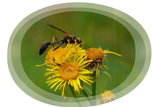
Sceliphron caementarium