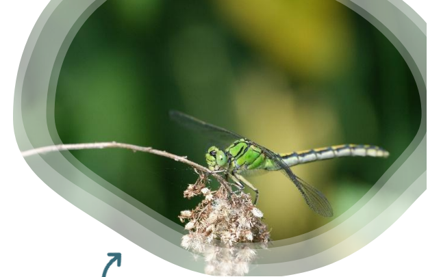
Ophiogomphus cecilia

Samedi 12 juillet : Rendez-vous naturaliste