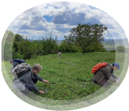
Bénévoles à la recherche de plantes

"MIEUX CONNAITRE C'EST MIEUX PROTÉGER !"